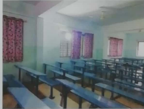
Projector Lab (Audio Lab)

PRINCIPAL VISHWA CHETHANA DEGREE COLLEGE College Code: 8D No: 36, Rajarajeshwari Layout, Hosur Road, Anekal-Tk, BANGALORE DIST-562 106